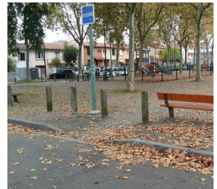
Cartoucherie Cité Bourrassol Place Baudin

Adhésion : €5 pour les particuliers / €15 Associations et Commerçants. Merci d'adresser votre adhésion au Comité : 246 Rue des Fontaines